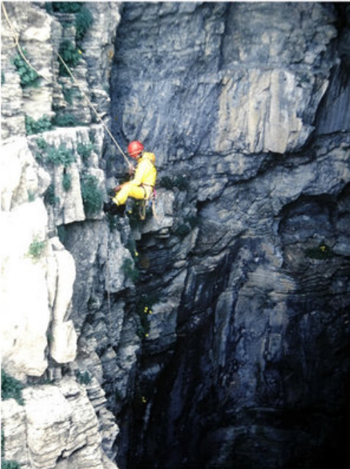
Εικόνα 7Φωτογραφία απο κατάβαση στην Προβατίνα (αποστολη ΣΕΛΑΣ 1998