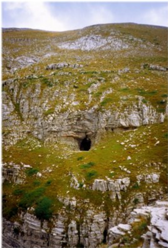
Εικόνα 3Η είσοδος της Προβατίνας