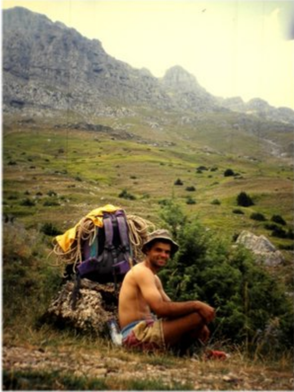
Εικόνα 60 υπογράφων σε μια στάση μας στο μονοπάτι προς την Προβατίνα