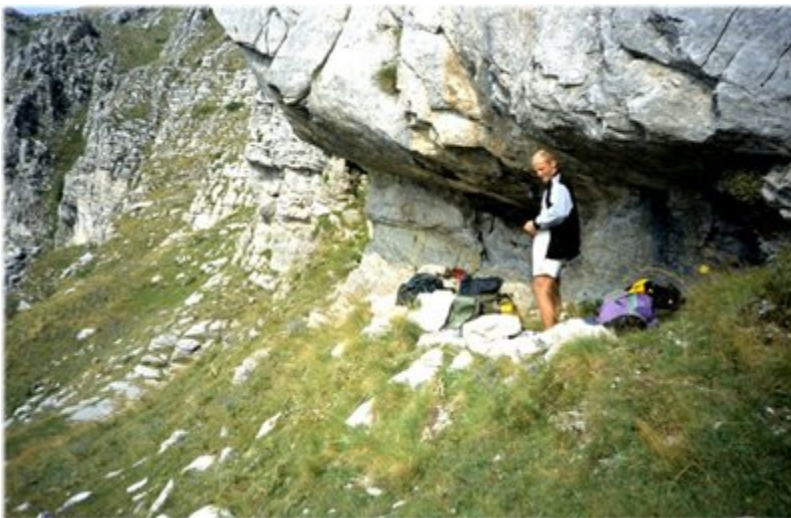
Εικόνα 4Η βραχοσκεπή που αποτέλεσε το κατάλυμα μας εκείνο το βράδυ